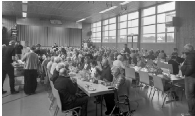
Text und Bilder: Feuerwehr Aichstetten