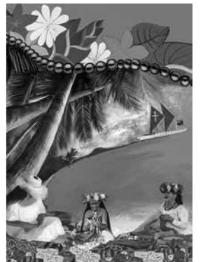
© 2023 World Day of Prayer International Committee, Inc.

Falls Sie eine Mitfahrgelegenheit suchen, können Sie sich gerne im Pfarramt Aichstetten melden.