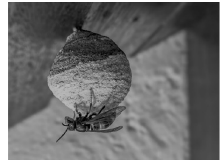
So sieht ein sogenanntes Embryonal- oder Anfangs-Nest der asiatischen Hornisse aus.